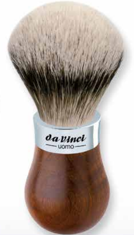
299 Rasierpinsel Ø 22 mm Griff aus beständigem und nachhaltigem Kebony®-Holz, Chromfassung Shaving brush Ø 22 mm handle made of highly durable and sustainable Kebony® wood, chrome setting