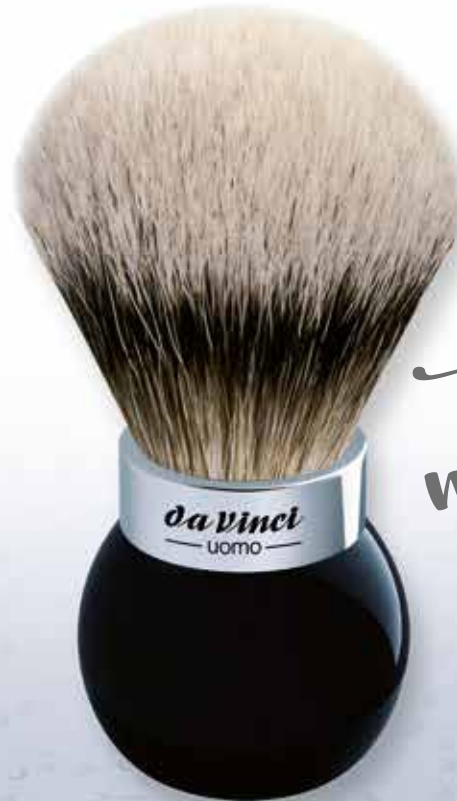
290 Rasierpinsel Ø 25 mm schwarzer Plexigriff, Chromfassung Shaving brush Ø 25 mm black perspex handle, chrome setting