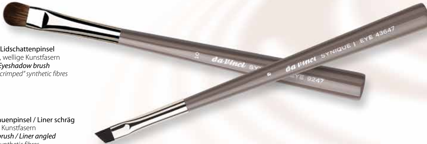
43647_8 Augenbrauenpinsel / Liner schräg extrafeine Kunstfasern Eyebrow brush / Liner angled extra fine synthetic fibres