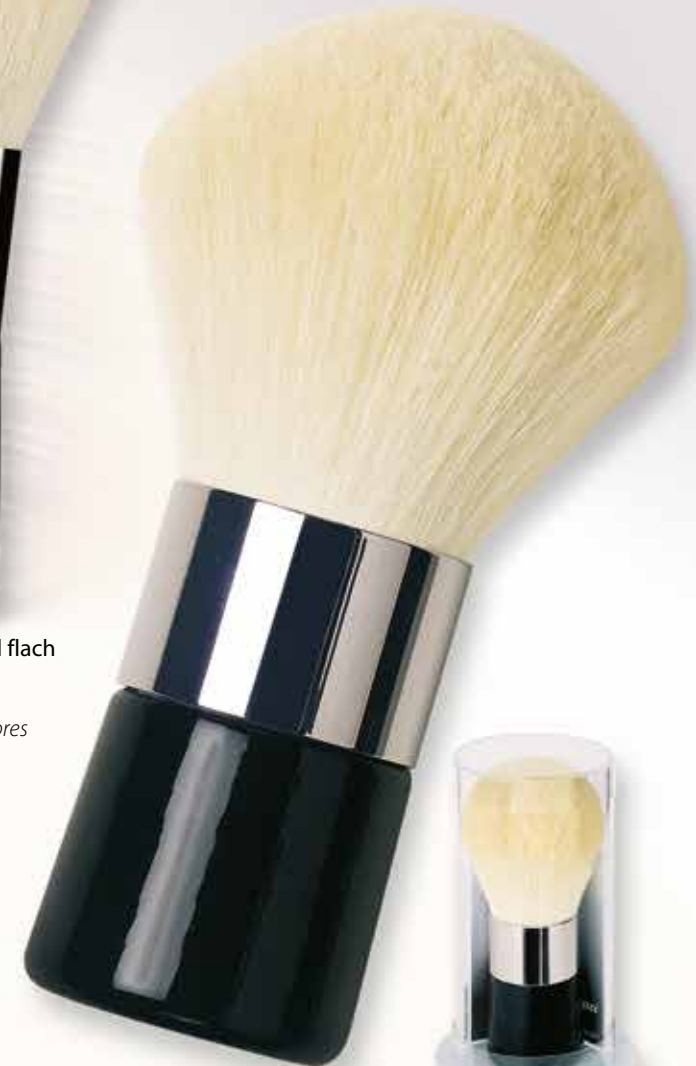
9993 Körperpuderpinsel weiße Bergziegenhaare Body Powder brush white mountain goat hair