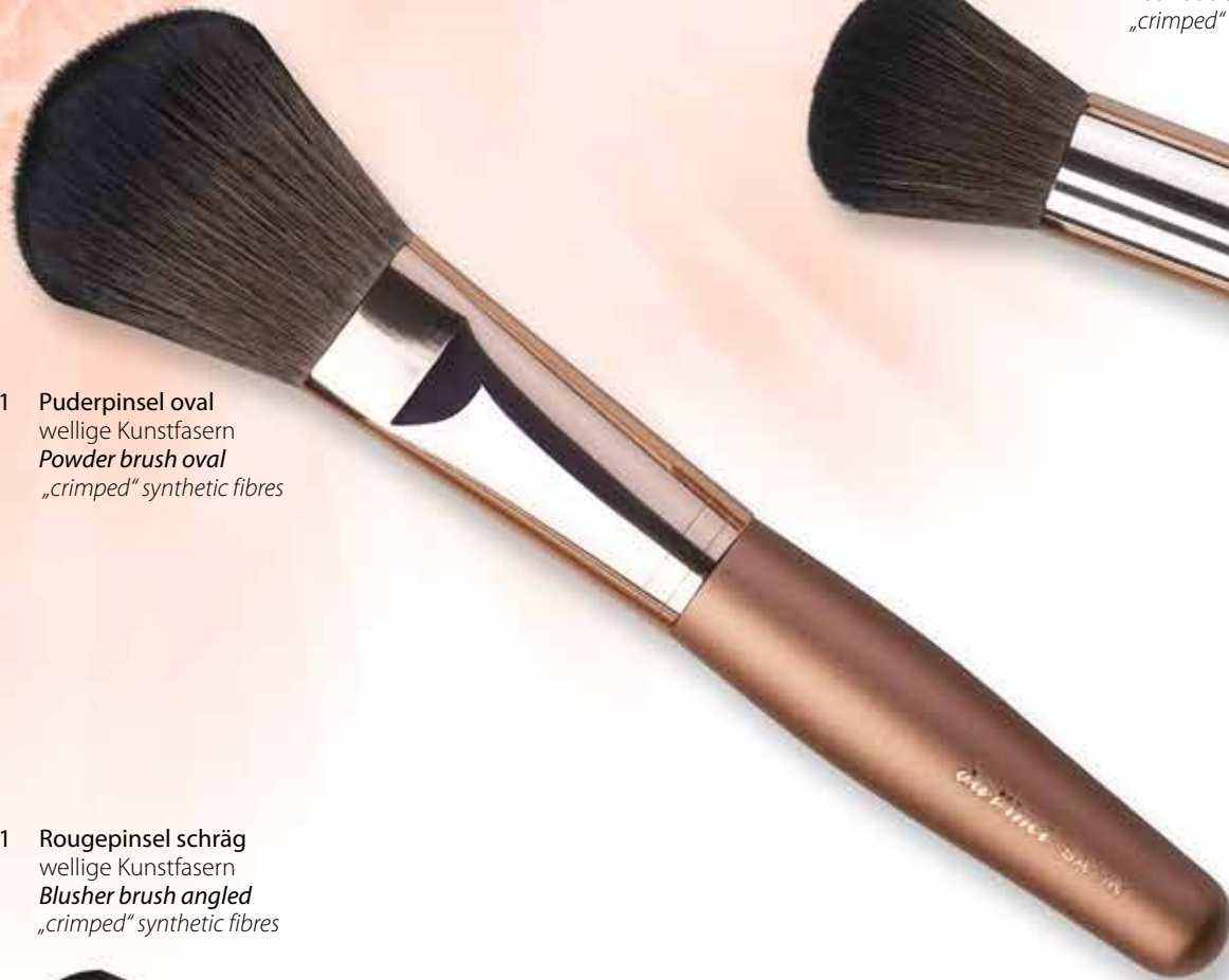
9511 Puderpinsel oval wellige Kunstfasern Powder brush oval „crimped“ synthetic fibres