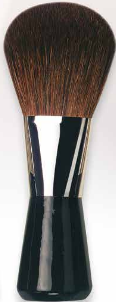
9523 Standpuderpinsel oval braune Bergziegenhaare Powder brush oval brown mountain goat hair