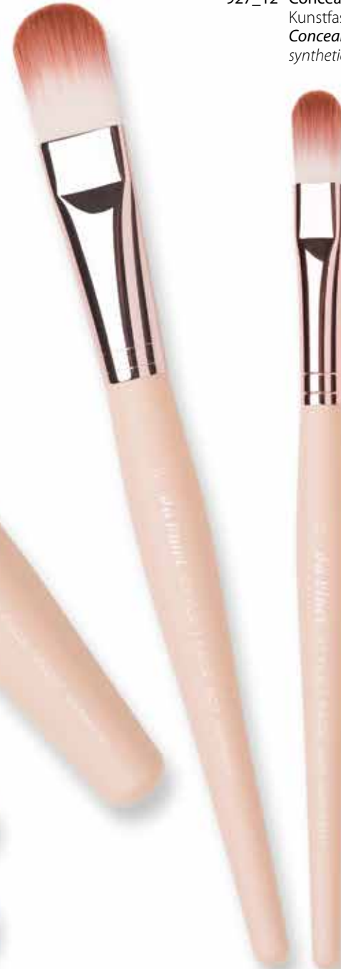
97227 Rougepinsel schräg wellige Kunstfasern Blusher brush angled „crimped“ synthetic fibres