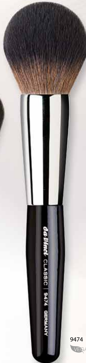
9474 Puderpinsel groß wellige Kunstfasern Powder brush large „crimped“ synthetic fibres