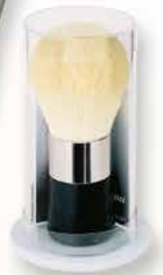
Originalverpackung Original packaging