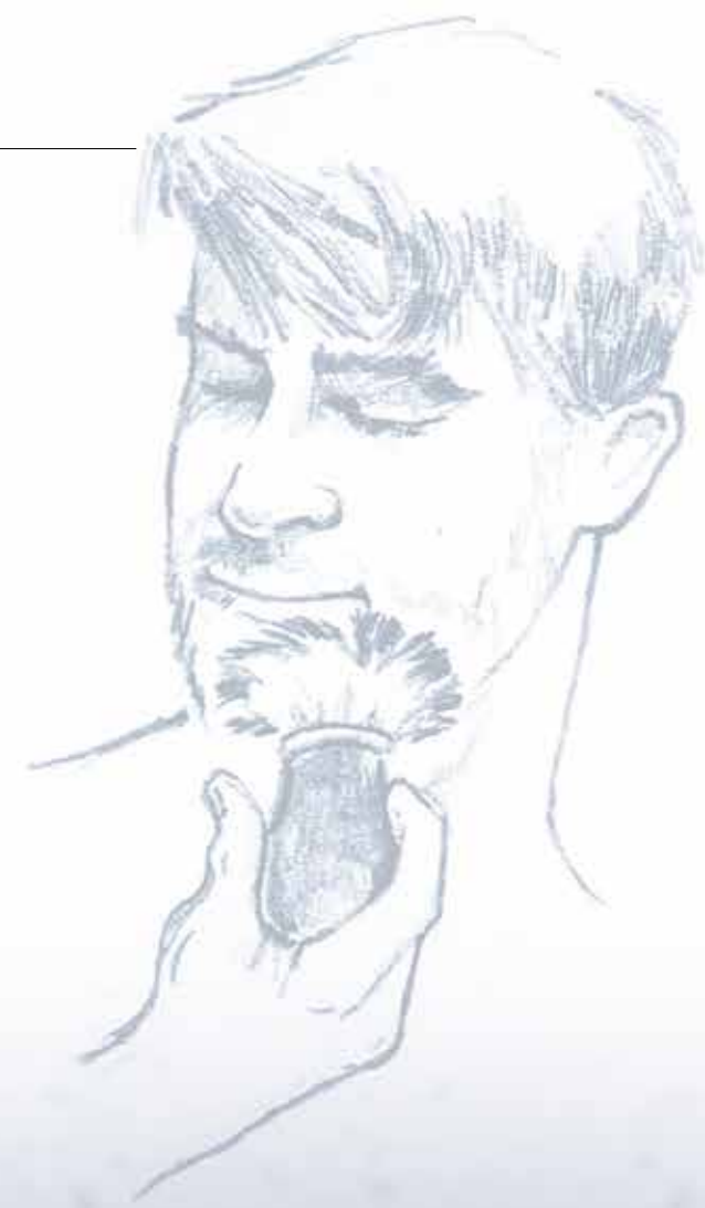
273 Rasierpinsel Ø 22 mm schwarzer Plexigriff, Chromfassung Shaving brush Ø 22 mm black perspex handle, chrome setting