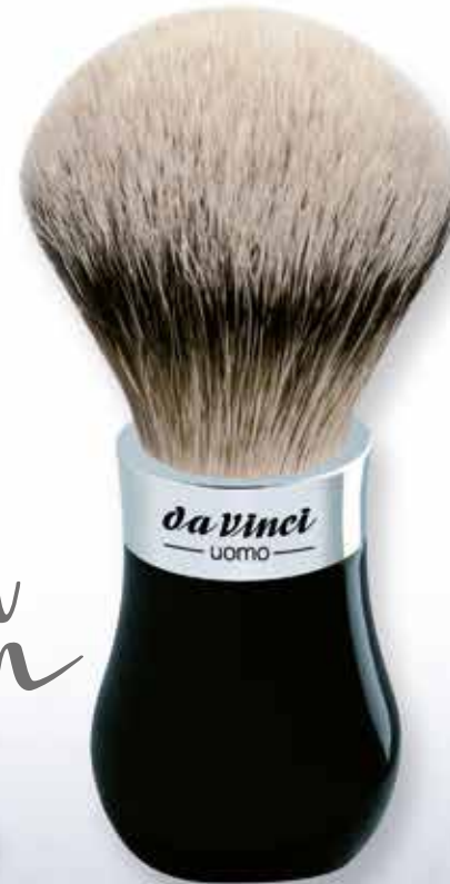
293 Rasierpinsel Ø 22 mm schwarzer Plexigriff, Chromfassung Shaving brush Ø 22 mm black perspex handle, chrome setting