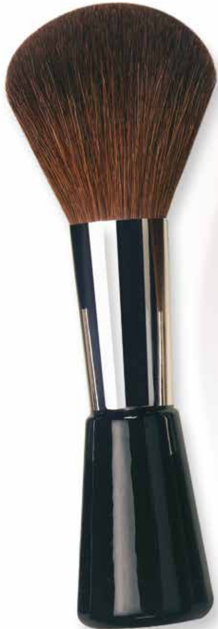
9923 Großer Standpuderpinsel braune Bergziegenhaare Large Powder brush brown mountain goat hair